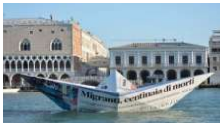
LAMPEDUSA. (2015). VIK MUNIZ

Cecilia Paredes eta Vik Muniz artisten artelanen bidez, ikasleek ibilbide bat egingo dute migrazioa. Horrela, "bizi-bidaia" kontzeptuak dakartzan zailtasunei buruz pentsatu ahal izango du. Errealitate horren ezagutza, migratzaileekiko enpatia eta mundu konplexu, global eta kulturantzun baten ikuspegia izango dira landu beharreko aldeerdietako batzuk. Horretarako, sormen-jarduera bat egingo da, ikasleek migrazio-bidaiaren historia propioa sortzeko aukera izan dezaten.