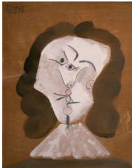
MOUSQUETAIKETE. (1967). - PABLO PICASSO

Programa honetan hainbat jarduerara artistiko proposatzen dira, hauek behaketa, sormena, emozioen mundua, ekimena eta komunikazio gaitasunak, ingeles hizkuntza barne, eta sozializazioa, besteak beste, garatzen laguntzeko. Horrela, kompetentziak eskuratu ahal dira, hala nola artistikoa edo pentsatzen ikastea. Hezkuntza programa osoa ipuin baten bidez egituratzen da, zeinak hari gidari gisa balio duen kantua, gorputz adierazpena eta plastika sortzailea bezalako jardueretarako.