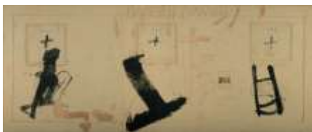
INCENDI. (1991). ANTONI TÀPIES