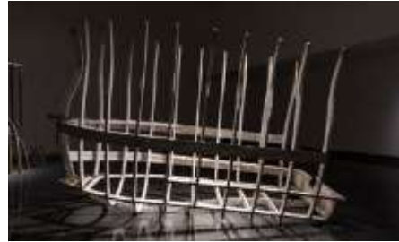
NO RETORNO. (2017). - CECILIA PAREDES LAMPEDUSA. - (2015). - VIK MUNIZ