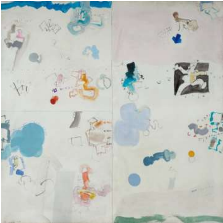
JARDINERO REGANDO. (1969). HERNÁNDEZ MOMPÓ

Programa honetan, ikasleek arreta hobetzen lan egin ahal izango dute. Horretarako, artelanei buruzko begirada sakona lantzen da, gero benetako objektuetara eramateko. Gainera, gorputza eta burua erlaxatzeko jarduerak bat egingo da, arreta kontrolatu ahal izateko. Azkenik, ikasleek Museoan duten esperientziari buruzko sormen-jarduerak bat egin ahal izango dute.