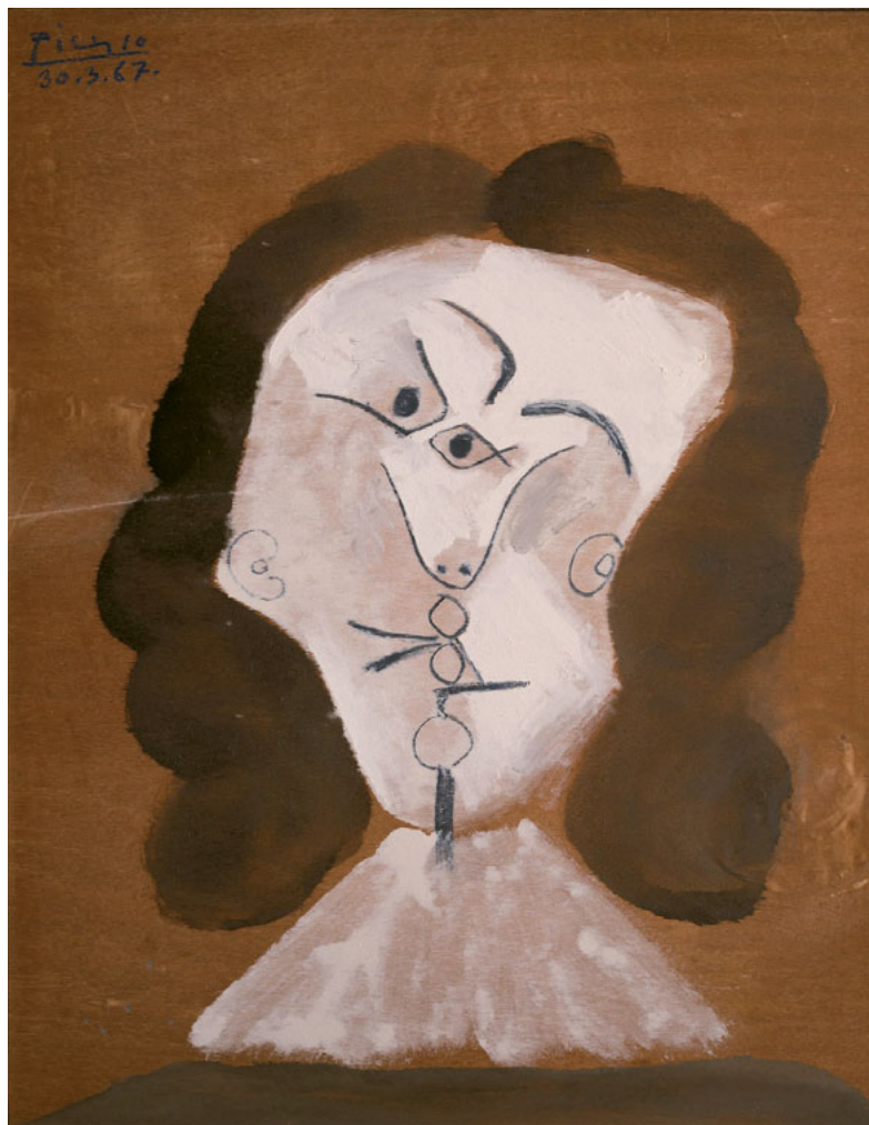
PORTADA MOUSQUETAIRE TÊTE (1967) © PABLO PICASSO

Post-visita: se realiza la visita en el centro educativo para contarles cómo ha ido la actividad y las obras realizadas, repasar lo que hicieron y agradecerles su participación e intervención.