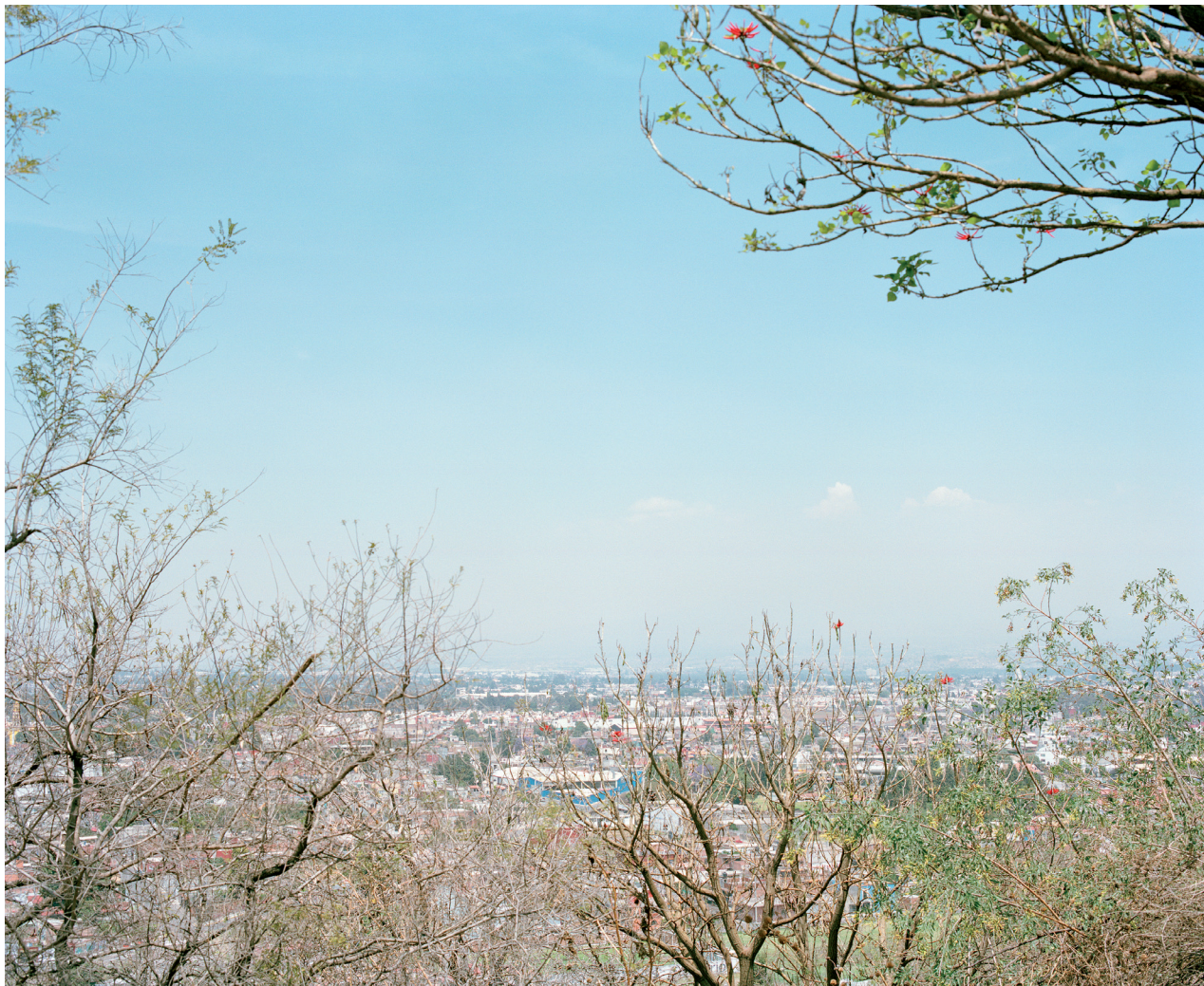
CHOLULA, DE PRONTUARIO. EL CONTINENTE Y EL VIENTO (2011-2013)