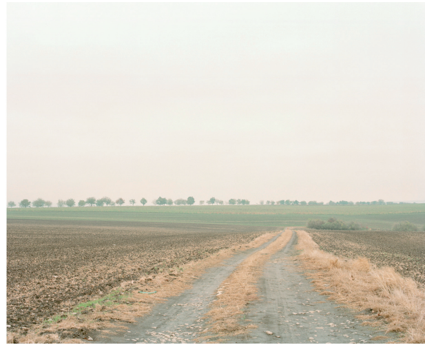
AUSTERLITZ, 2 DE DICIEMBRE DE 1805, DE CAMPOS DE BATALLA. EUROPA (2010-2012)