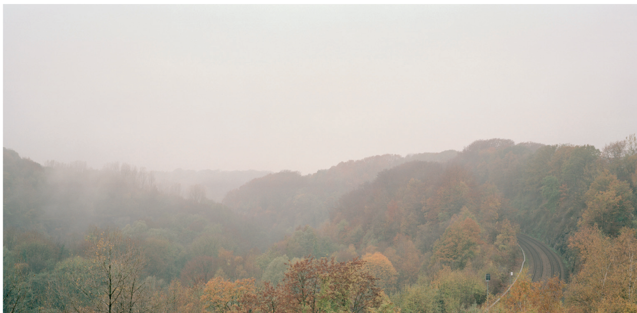
HOMO NEANDERTHALENSIS. VALLE DE NEANDER (2004), DE ORIGEN (2003-)

mirada a aquellos pequeños espacios cotidianos, lúdicos, que formaron parte de su infancia (y de la nuestra). Situados por lo general en áreas periféricas, en las afueras de pueblos y ciudades, estos campos han quedado progresivamente abandonados, vaciados de su función. Son geografías menores, que podrían pasar desapercibidas, pero que de algún modo tienen una fuerte carga de memoria. Espacios vividos en el pasado, que ahora se nos muestran vacíos, silenciosos.