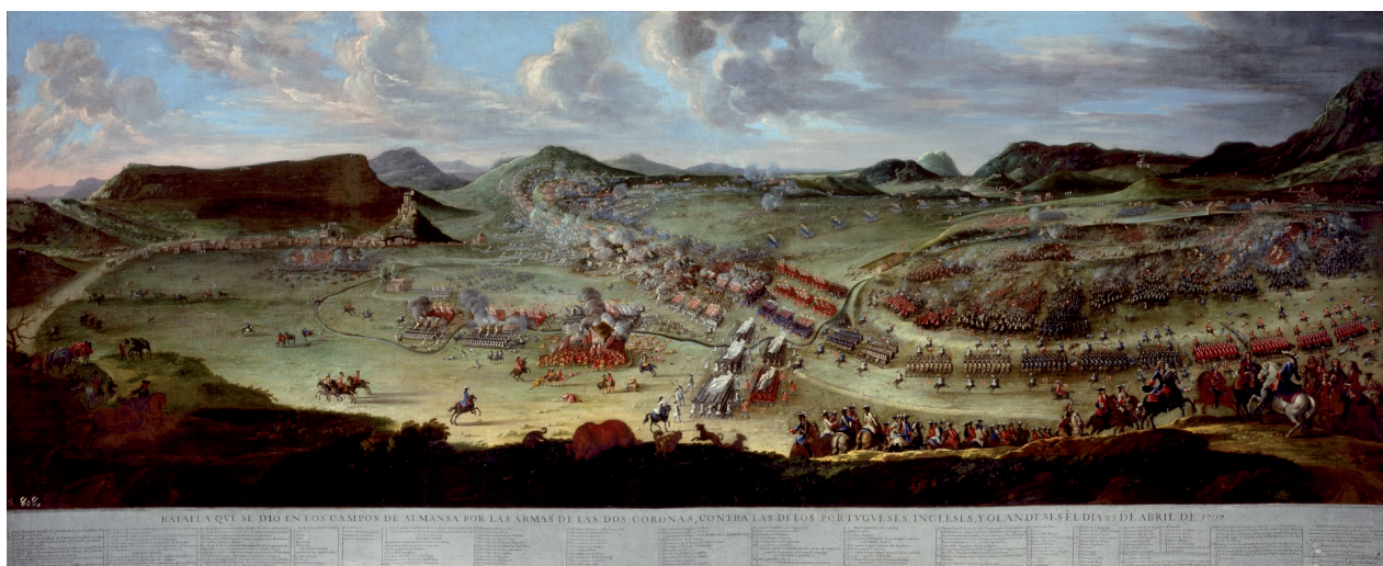
LA BATALLA DE ALMANSA (1709). BUONAVENTURA LIGLI Y FILIPPO PALLOTTA. MUSEO DEL PRADO

proporcionándonos la principal clave de lectura en un paisaje difícilmente identificable a primera vista.