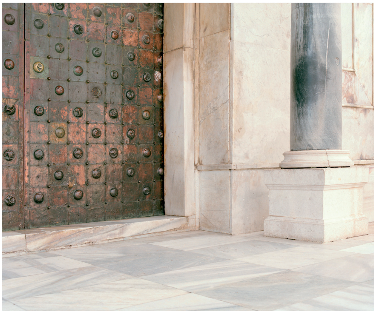
CÚPULA DE LA ROCA. MONTE DEL TEMPLO (2010), DE MEMORIALES. JERUSALÉN (2005-2010)