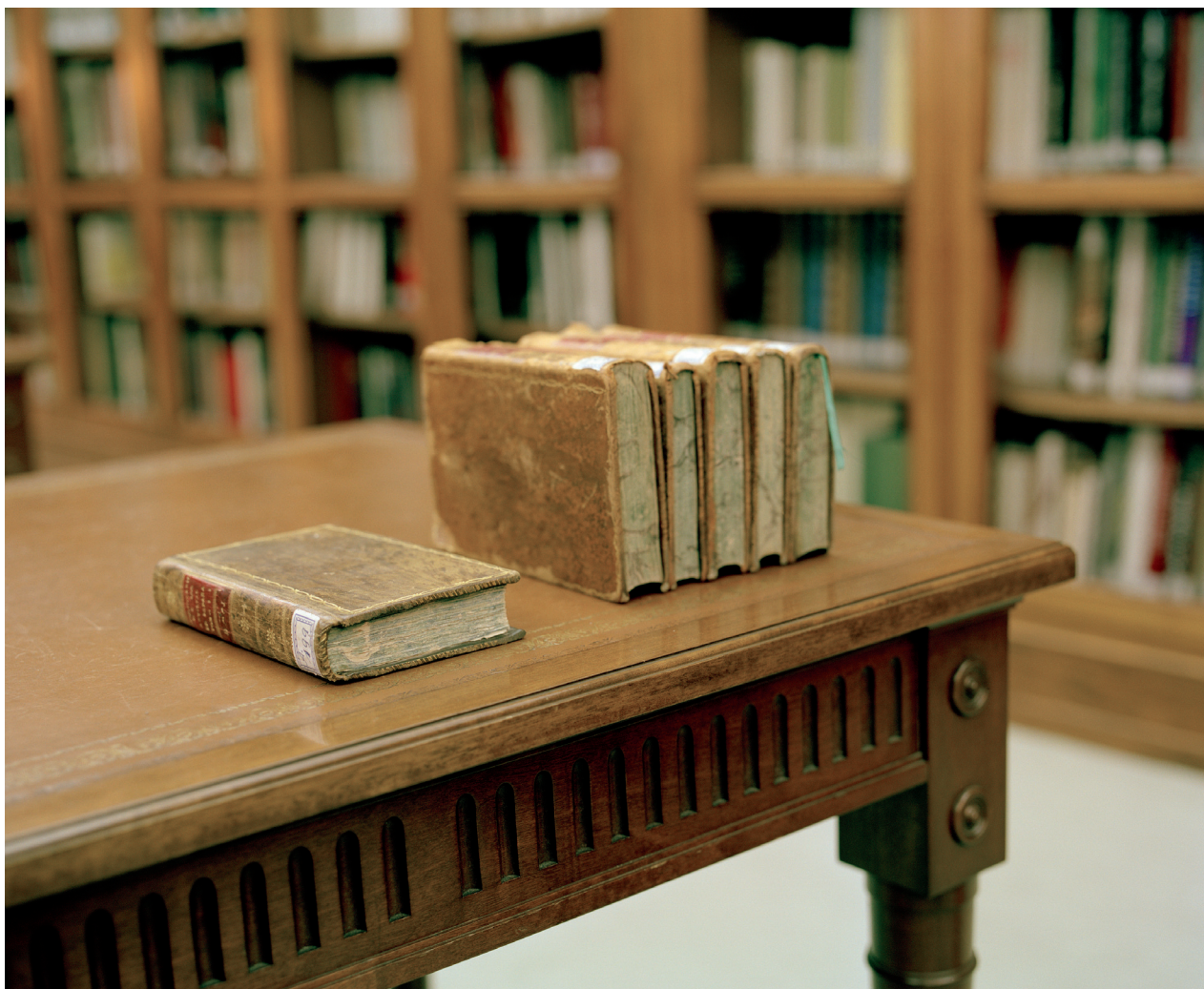
DICCIONARIO HISTÓRICO DE LOS MÁS ILUSTRES PROFESORES DE LAS BELLAS ARTES EN ESPAÑA (2013), DE PRONTUARIO. NOTAS EN TORNO A LA GUERRA Y LA REVOLUCIÓN (2011-2013)

El término Prontuario hace referencia a un compendio de anotaciones, un lugar en el que reunir y almacenar imágenes y textos. Concebidas inicialmente como carpetas, estas se despliegan en forma de paneles o en vitrinas. Dispuesta en la pared, podemos observar la serie Notas en torno a la guerra y la revolución . Cada pieza de este conjunto recoge nueve fotografías de lugares en los que se produjo algún tipo de tensión histórica, dentro del contexto de la Guerra de la Independencia en España, un proceso que se nutrió de los ideales liberales, de los alzamientos populares, de las revueltas y de la necesidad de establecer un nuevo orden político. Concebidas y ordenadas al galdosiano modo de cinco episodios (los asedios de Gerona y Cádiz, las batallas de Vitoria y Trafalgar y el levantamiento popular de Madrid), reflexionan a través de ellas sobre el período que va de 1808 a 1814. En las vitrinas se disponen las 32 fotografías y fragmentos de texto que conforman la serie El continente y el viento , que a su vez se divide en dos bloques: las primeras expediciones de conquista, por un lado; y las expediciones científicas que llevaron el movimiento ilustrado a América, por otro.