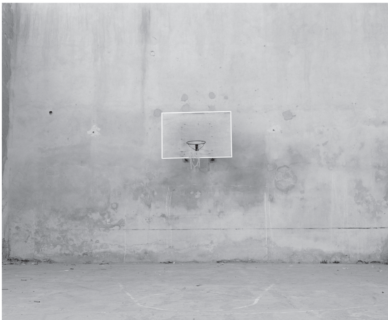
ACCIDENTE TOPOGRÁFICO II (1994), DE CAMPOS DE FÚTBOL (1992-1995)

pieces divided into three sections/cities representing not only commemorative monuments, but also some less evident traces of history in the urban fabric. The locations are indicated in the caption, not by what can be seen in photo to itself, because each place has been documented using a tight shot that does not reveal the entire space, thus making it more difficult to recognize.