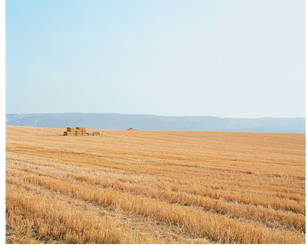
MENSAZA, INVIERNO DE 1834, DE CAMPOS DE BATALLA. ESPAÑA (1994-1999)

observed at the time of making an image, but the content references that which was previously obtained and has morphed into what can be seen now". This relationship between memory and history is in direct opposition to Henri Cartier Bresson's "decisive moment".