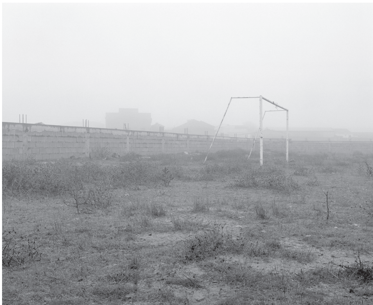
EL BALLESTERO (1992), DE CAMPOS DE FÚTBOL (1992-1995)