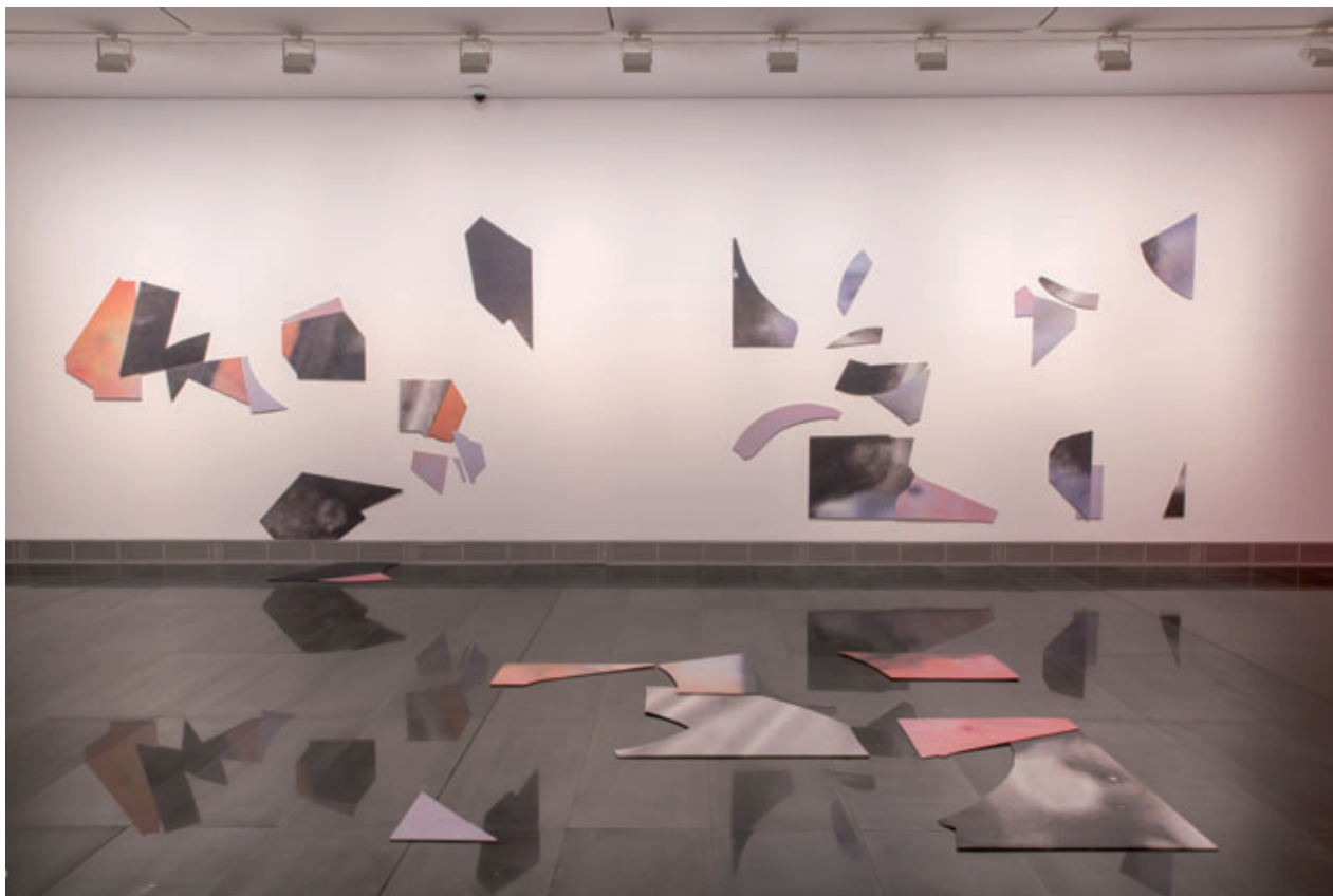
SALA 4.1, CON OBRAS DE MIREN DOIZ

los con ideas cerradas del concepto resto , contribuyó a diversificar la propuesta expositiva en diferentes caminos formales y conceptuales.