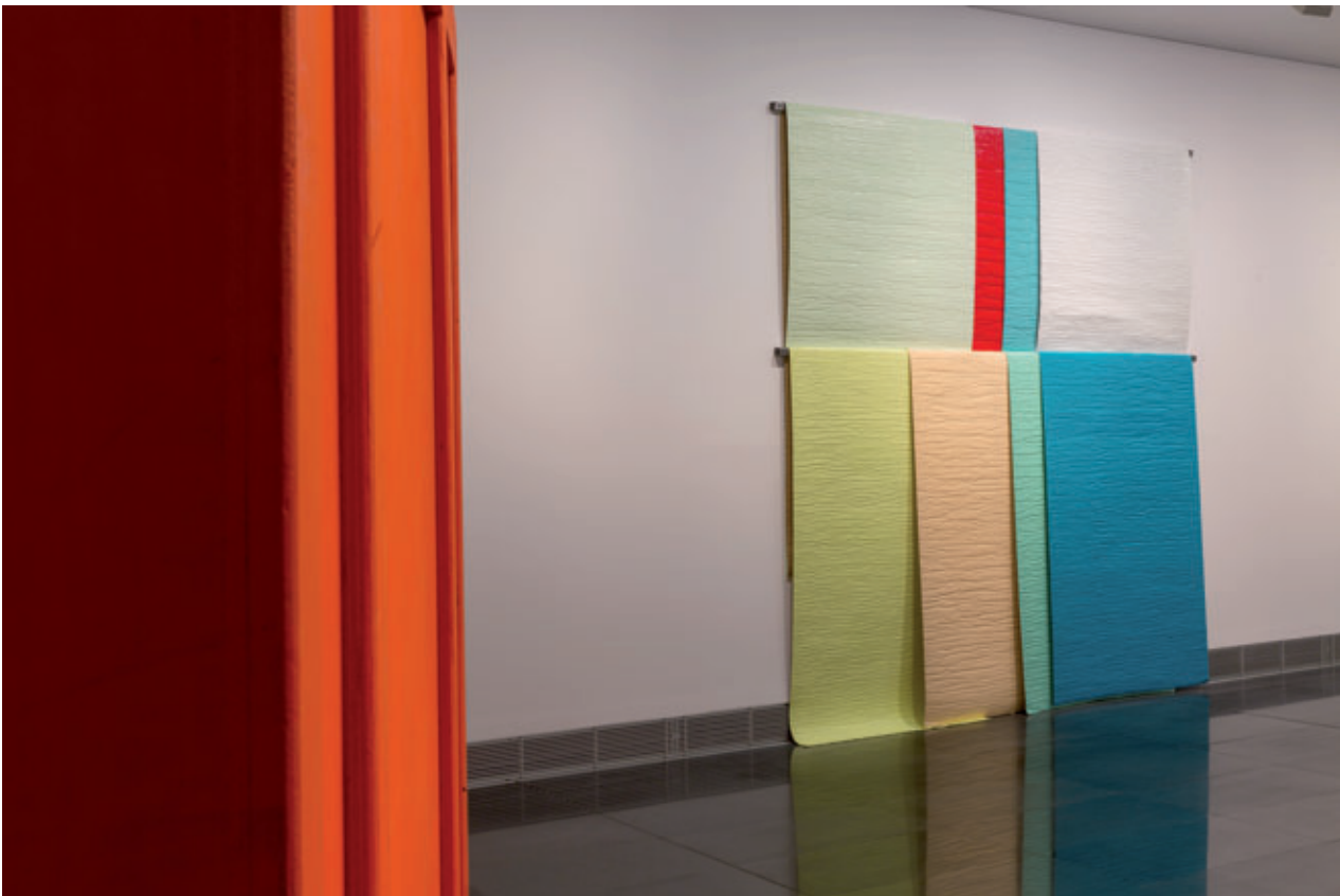
SALA 4.2, CON OBRAS DE IRMA ÁLVAREZ-LAVIADA

estos dos años como ejes cronológicos de la obra, el artista consigue jugar con la cualidad temporal de la producción artística, subrayando su valor y generando un punto reflexivo entorno a ello.