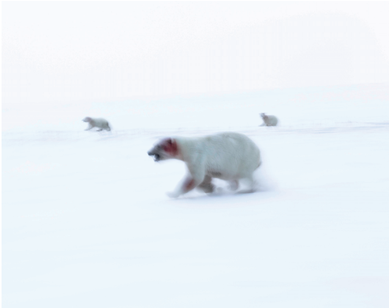
MAPAS DE LO INVISIBLE. 2022. CORTESÍA ÁLVARO LAIZ

is reflected in a series of images of stars, constellations and galaxies captured by the Hubble telescope. What we perceive as present-day images took 500 to 30,000 light-years to reach the Earth, so when we look at the stars, we are actually seeing images from the recent past.