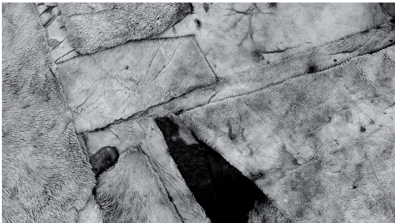
TÓTEM. 2022.

types” as photographers such as Alphonse de Launay, Robert Peters Napper, Jean Laurent and José Ortiz Echagüe, whose works are included in the Museo Universidad de Navarra collection. The aim was to document these popular types through the prism of the aesthetics of the period, and the sensibility and personal experiences of each of these photographers, by capturing not only the subjects’ physical and psychological features, but also their environment and context, based on the clear influence of established stereotypes and archetypes. These images offer a glimpse of what the people were like at that time, something we do not know about the settlers who crossed the Bering Strait, whose only remains are the DNA they left in their descendants’ genes.