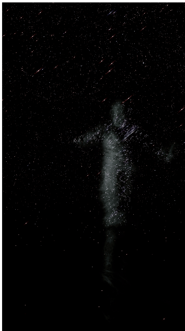
LA CAVERNA (DETALLE). 2022.

enfatisa todavía más la indefinición de sus contornos, así como la ausencia de un espacio o un lugar, que se sustituye por las coordenadas geográficas en las que se ha tomado la imagen, que se convierten en su título. Y ello se debe a la percepción de Laiz del retrato como un reconocimiento mutuo entre dos personas, y que a través de la repetición de las coordenadas, a modo de una oración, se vincula con la memoria, lo imperceptible, el pasado y el futuro. Y esto a pesar de que Laiz compartía, tanto formal como temáticamente, el mismo interés por los retratos fenotípicos de tipos populares de autores como De Launay, Napper, Laurent u Ortiz Echagüe, presentes en la colección del Museo Universidad de Navarra. En ellos se intentaba, bajo el prisma de la estética propia de la época, la sensibilidad y las vivencias personales de cada autor, documentar los tipos populares, mediante la captación no solo de sus rasgos físicos y psicológicos, sino también de su entorno y contexto, con una clara influencia de estereotipos y arquetipos ya asentados. Estas imágenes nos permiten ver cómo era el hombre en ese momento, algo que no sabemos de los pobladores que cruzaron el estrecho de Bering, de los que tan solo queda