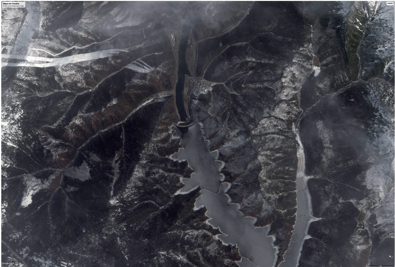
PRESA SAYANO SHUSHENSKAYA. SERIE POSTALES PARA MAÑANA. 2022.

continente miles de años atrás. Al mismo tiempo, en estas imágenes desdibujadas se refleja cómo el tiempo y la memoria no siempre responden a una concepción lineal de la historia, ya que en ellas vemos como se interrelacionan pasado, presente y futuro.