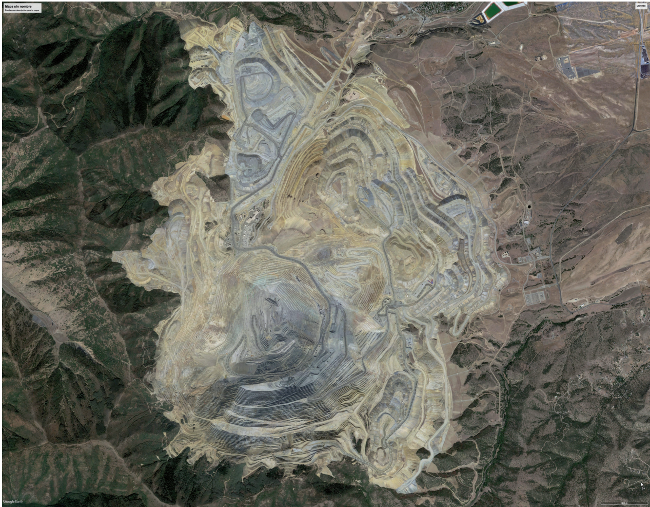
RÍO TINTO KENNECOTT COPPER MINE II. SERIE POSTALES PARA MAÑANA. 2022

ies, but can also be seen in many of the customs shared by all these peoples, including the spiritual aspects of many of their customs and traditions. The region's animist cults based on observing and conversing with nature provide a glimpse of a specific way of living and relating to the world. To understand this feat of migration, Laiz began a dialogue between science and art, and between population genetics and images. The result of this research is related to the concept of collective memory, which encompasses all perceptions common to all of us that are passed down from generation to generation to become part of our DNA.