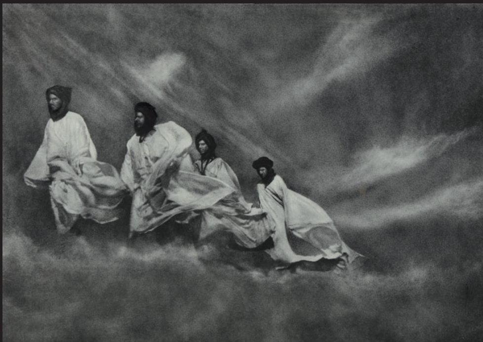
SIROCO EN EL SAHARA, 1965. JOSÉ ORTIZ ECHAGÜE