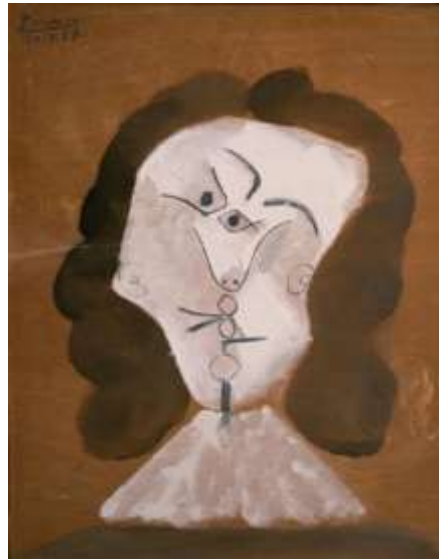
MOUSQUETAIKETE. (1967). - PABLO PICASSO

Programa honetan hainbat jardueren artistiko proposatzen dira, hauek behaketa, sormena, emozioen mundua, ekimena eta komunikazio gaitasunak, ingeles hizkuntza barne, eta sozializazioa, besteak beste, garatzen laguntzeko. Horrela, kompetentziak eskuratu ahal dira, hala nola artistikoa edo pentsatzen ikastea. Hezkuntza programa osoa ipuin baten bidez egituratzen da, zeinak hari gidari gisa balio duen kantua, gorputz adierazpena eta plastika sortzailea bezalako jardueretarako.