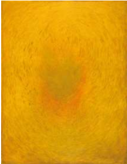
PTINTURA. (1967). - JAIÑE BURGUILLOS

Programa hau haur eskoletan egiteko prestatuta dago. Hezkuntza-baliabideek ipuinak, arte-lanen erreprodukzioak, aurkikuntza-kutxa bat eta arte garaikidera modu ludikoan hurbildu ahal izateko musika-kit bat biltzen dituzte.