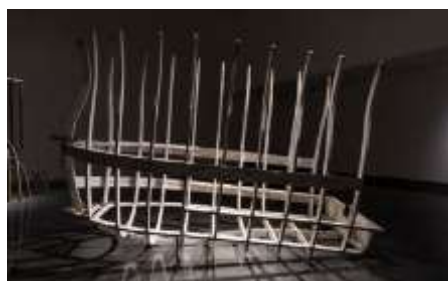
NO RETORNO. (2017). CECILIA PAREDES